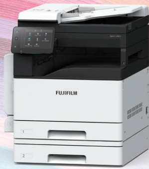
Apeos C2450 S 搭配選購紙盤模組